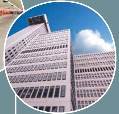
Centro Commerciale Scandinavia, Solna