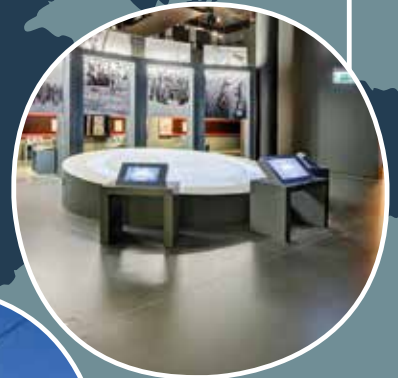
Hotel Mövenpick, Losanna